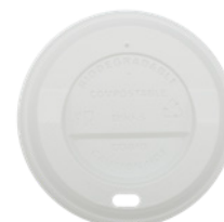
1BG359 TAPA CON PICO C-PLA Para vaso 10, 12 Y 16oz dimensión size Ø 90 mm pz/conf pcs/pack 100 pz/cart pcs/box 1000