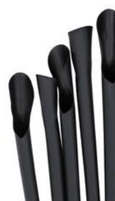
1CAN51 BOMBILLA CON CUCHARITA BIO-ECO dimensioni size h 210mm / Ø 6mm pz/conf pcs/pack 250 pz/cart pcs/box 6000