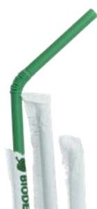
1CAN64 BOMBILLA FLEX BIO-ECO ENVUELTA EN PAPEL dimensioni size h 240mm / Ø 5mm pz/conf pcs/pack 400 pz/cart pcs/box 6400