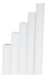
1CAN41 BOMBILLA RECTAS BLANCAS BIO-ECO dimensioni size h 210mm / Ø 6mm pz/conf pcs/pack 150 pz/cart pcs/box 3450