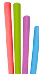
1CAN59 BOMBILLA RECTA COLORES O BIO-ECO dimensiones size h 210mm / Ø 6mm pz/conf pcs/pack 250 pz/cart pcs/box 6000