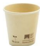
1BG668 VASOS CAFÈ BAMBÚ+ PLA capacidad capacity 75cc / 2,5oz pz/conf pcs/pack 100 pz/cart pcs/box 2000