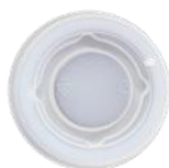
1CAN08 TAPA PIANA C-PLA Para vaso 2,5oz dimensión size Ø 58 mm pz/conf pcs/pack 100 pz/cart pcs/box 2000