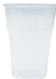
1VP184 VASO KRISTAL BIO capacidad capacity 400cc Marca/filling line 0,30 pz/conf pcs/pack 50 pz/cart pcs/box 1000