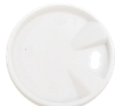
1BG360 TAPA CON PICO C-PLA Para vaso 4oz dimensión size Ø 62 mm pz/conf pcs/pack 100 pz/cart pcs/box 1000