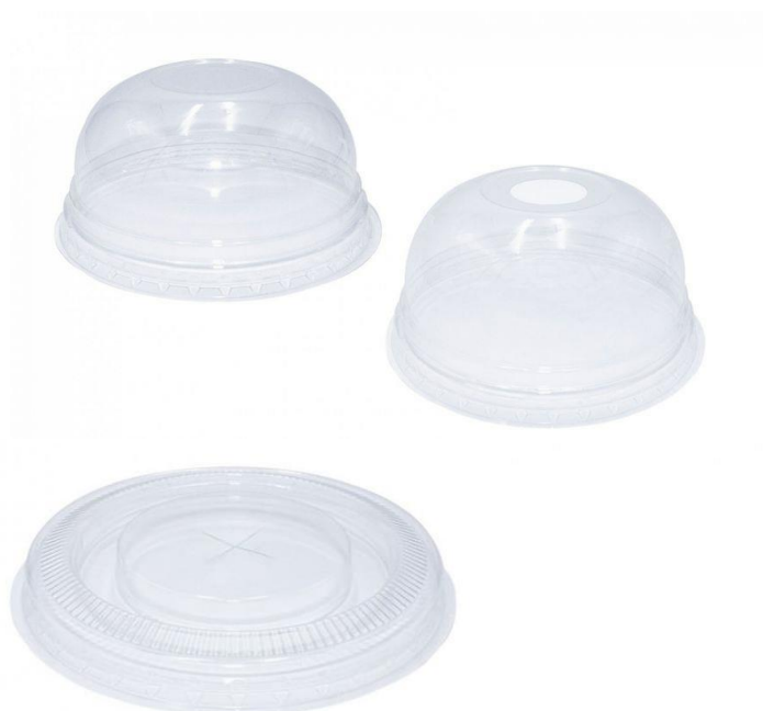
1VP189 TAPA DOMO FORADA PARA VASO KRISTAL BIO 400cc Diametro 8,5cm pz/conf pcs/pack 50 pz/cart pcs/box 800