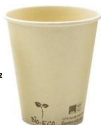
3BG674 VASOS CAFÈ BAMBÚ + PLA capacidad capacity 350cc / 10oz pz/conf pcs/pack 50 pz/cart pcs/box 1000