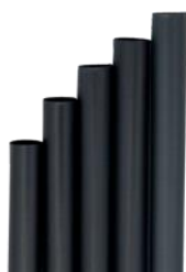
1CAN62 BOMBILLA RECTA NEGRAS COCKTAIL BIO-ECO dimensioni size h 150mm / Ø 8mm pz/conf pcs/pack 250 pz/cart pcs/box 3000