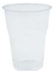
1VP186 VASO KRISTAL BIO capacidad capacity 250cc marca /filling line 0,20 pz/conf pcs/pack 50 pz/cart pcs/box 1500