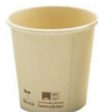
1BG669 VASOS CAFÈ BAMBÚ + PLA capacidad capacity 120cc / 4oz pz/conf pcs/pack 50 pz/cart pcs/box 2000