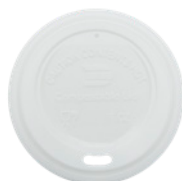
1BG353 TAPA CON PICO C-PLA Para vaso 7oz dimensión size Ø 74 mm pz/conf pcs/pack 100 pz/cart pcs/box 2000