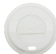
1BG358 TAPA CON PICO C-PLA Para vaso 8oz dimensión size Ø 80 mm pz/conf pcs/pack 100 pz/cart pcs/box 1000