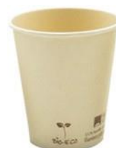
1BG670 VASOS CAFÈ BAMBÚ + PLA capacidad capacity 200cc / 7oz pz/conf pcs/pack 50 pz/cart pcs/box 2000