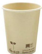
1BG672 VASOS CAFÈ BAMBÚ + PLA capacidad capacity 250cc / 8oz pz/conf pcs/pack 50 pz/cart pcs/box 1000