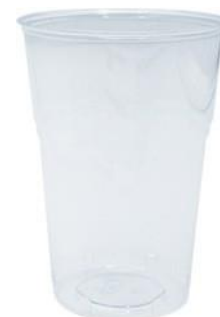
1VP180 VASO KRISTAL BIO capacidad capacity 575cc Marca/filling line 0,40 pz/conf pcs/pack 50 pz/cart pcs/box 800