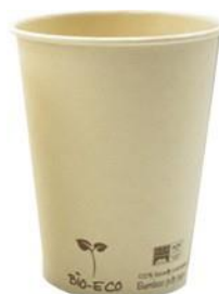
1BG676 VASOS CAFÈ BAMBÚ + PLA capacidad capacity 420cc / 12oz pz/conf pcs/pack 50 pz/cart pcs/box 1000