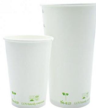
1BG039 VASOS CAFÈ PAPEL BLANCO + PLA capacidad capacity 550cc / 16oz pz/conf pcs/pack 50 pz/cart pcs/box 1000