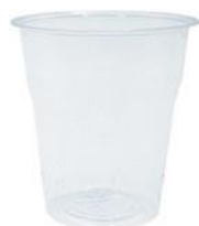
1VP185 VASO KRISTAL BIO capacidad capacity 200cc pz/conf pcs/pack 50 pz/cart pcs/box 1500